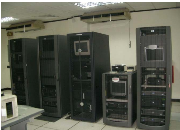
iDAS SCADA System ExxonMobil

Kami juga melayani in house training untuk para staff yang ingin mendalami kemampuan dalam penggunaan aplikasi bisnis (MS Office) tingkat lanjut. Demikian juga halnya jika lembaga pendidikan tinggi hendak mengadakan lokakarya (workshop) yang berkaitan dengan Informasi Teknologi (Disain Grafis, Animasi, Teknik pemrograman tingkat lanjut dan lain-lain), maka kami siap memberikan layanan terbaik dalam hal ini.