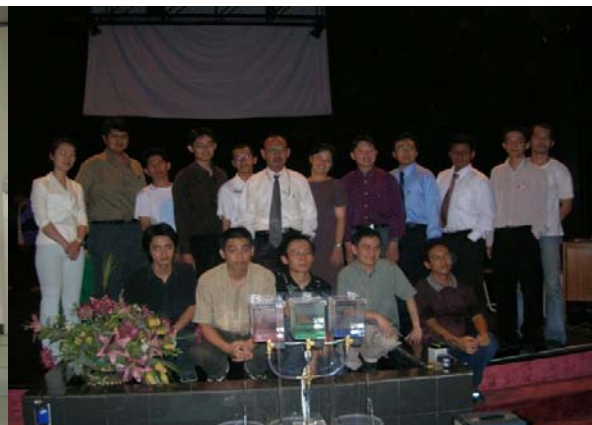
Workshop PLC di kampus Maranatha Bandung