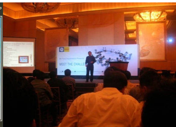
Seminar SCADA di Sheraton Hotel Jakarta