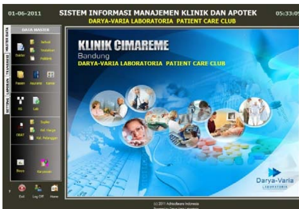
SIM Aplikasi Klinik Cimareme Bandung